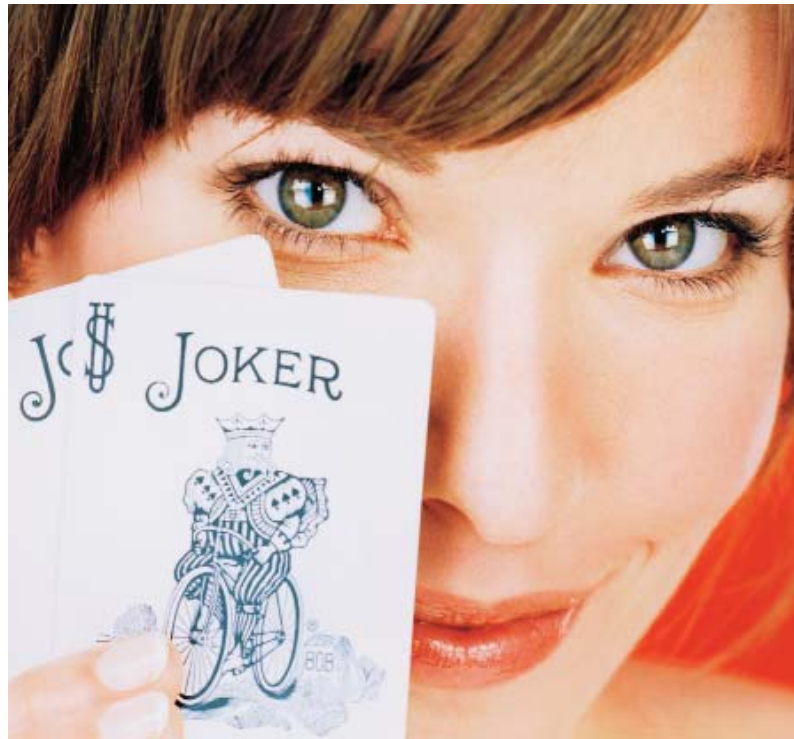
IPV-Konditionen jetzt auch für private Krankenversicherungen