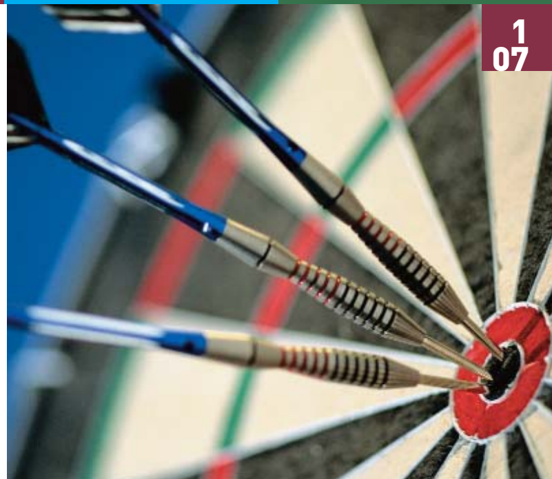
Volltreffer für Selbstständige - die Basis-Rente!

Weitere Informationen zur Basis-Rente können Sie mit dem Coupon ⑥ anfordern.