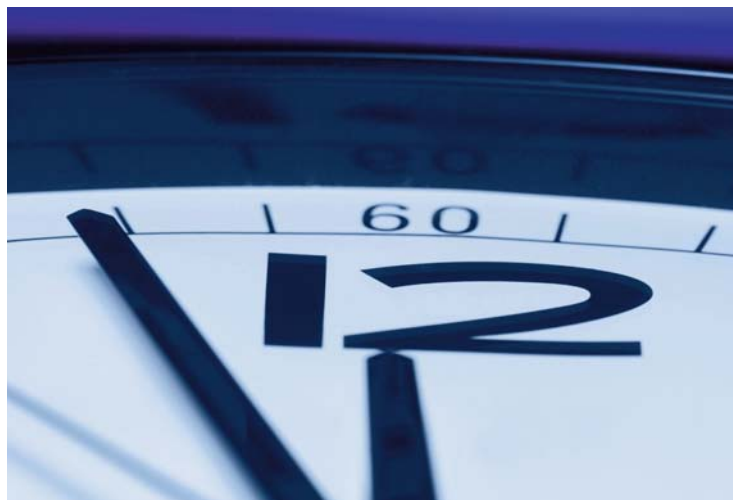
Pflegebedürftigkeit kann jeden treffen - sorgen Sie rechtzeitig vor!

jederzeit treffen - und es ist keine Frage des Alters!