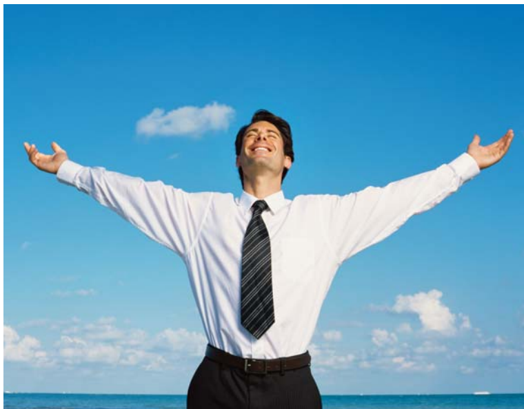
Aufatmen für Selbstständige