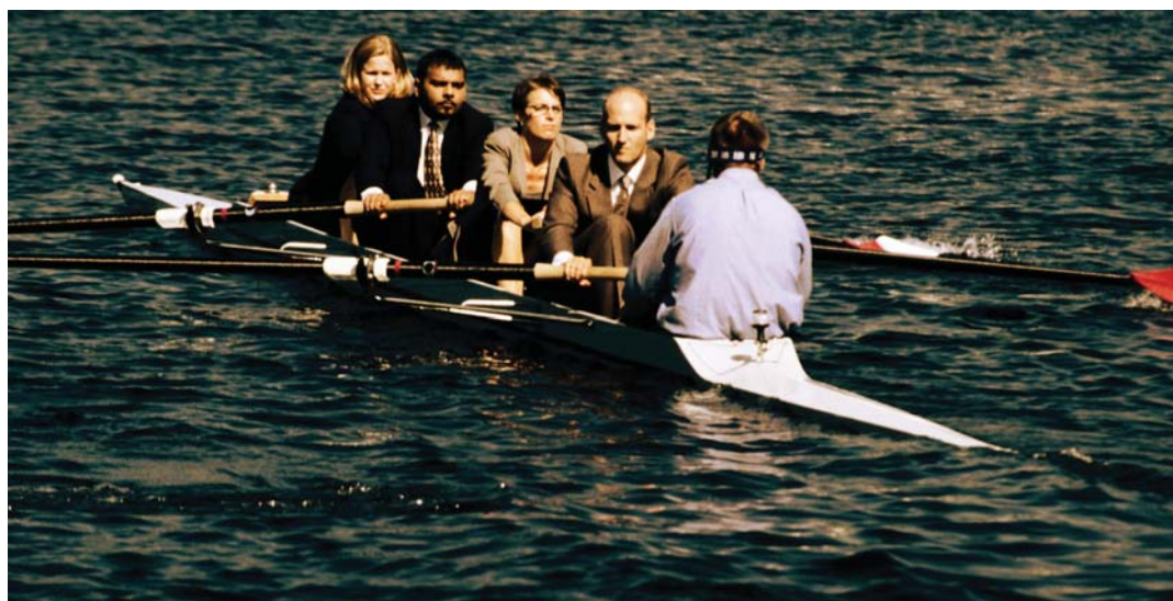
Bei Familien-GmbH's sitzen alle in einem Boot - eine unzureichende Versorgung trifft alle!

Spätestens im Leistungsfall wird geprüft, ob überhaupt eine abhängige Beschäftigung vorliegt