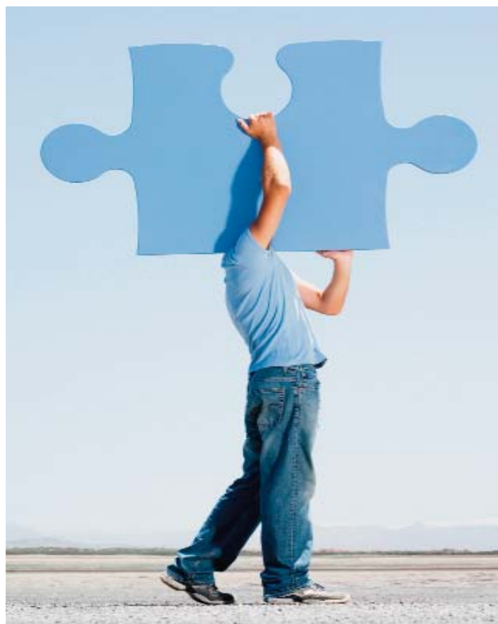
Mit dem optimalen „Puzzlestück“ zur sicheren Altersversorgung!

Im Gegenzug werden die Leistungen aus der Basis-Rente